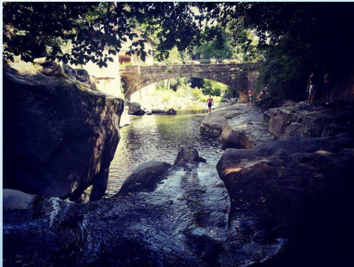
Il «Pozzone» e il ponte della Ferriera