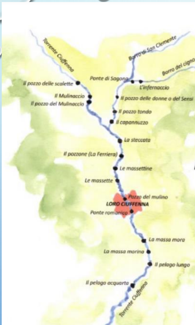
Mappa del fiume Ciuffenna